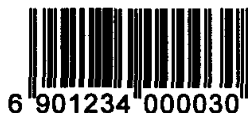
图 C.1 表示 13 位数字代码的 EAN-13 条码示例