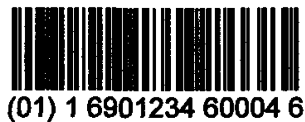
图 C.5 包装指示符为“1”的 UCC/EAN-128 条码示例