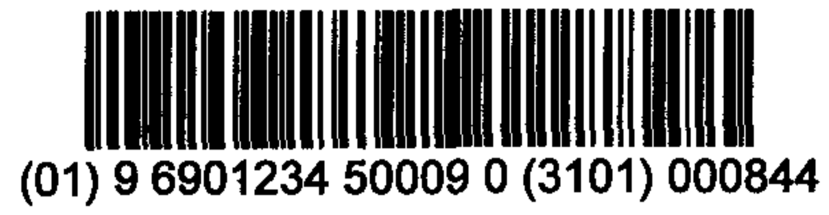
图 C.7 质量是 84.4 kg 的变量储运包装商品的 UCC/EAN-128 条码示例