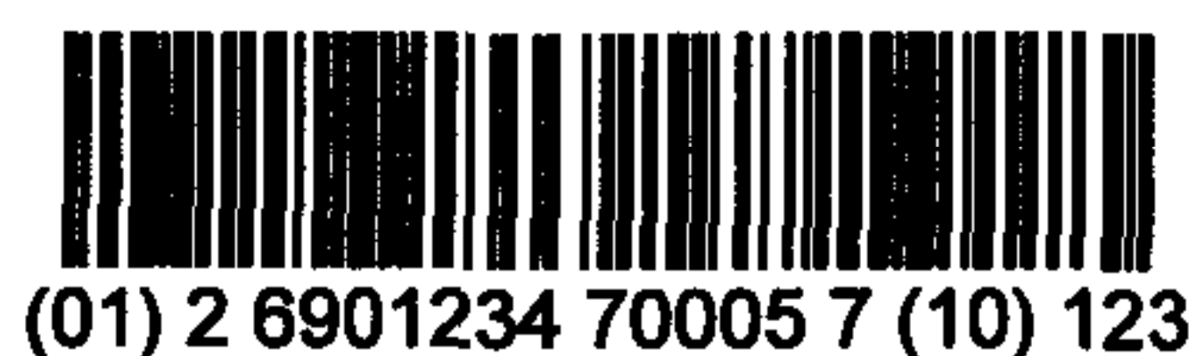
图 C.6 含批号“123”的 UCC/EAN-128 条码示例