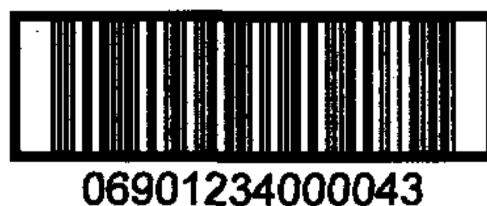
图 C.2 表示 13 位数字代码的 ITF-14 条码示例