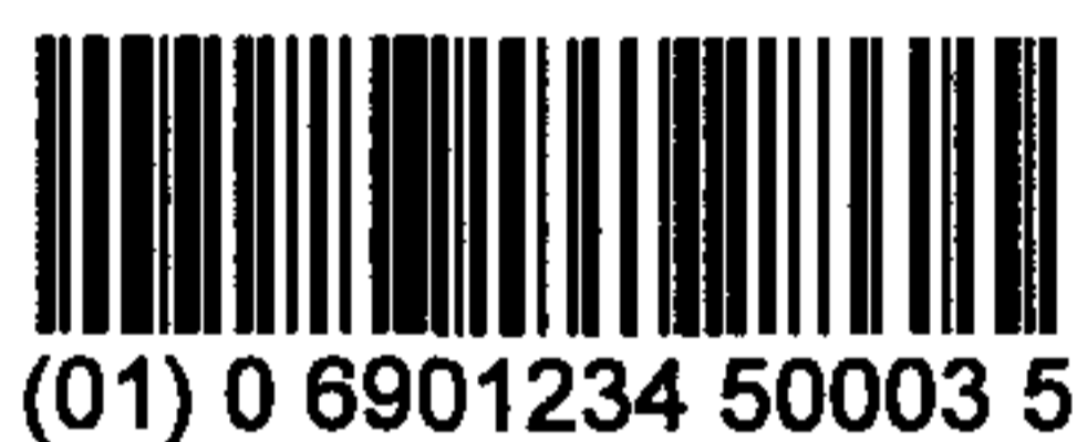
图 C.3 表示 13 位数字代码的 UCC/EAN-128 条码示例